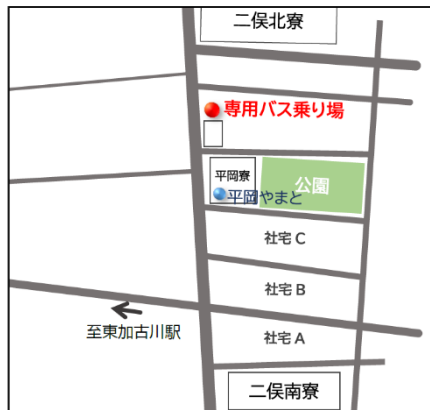
◆二俣寮ロータリー