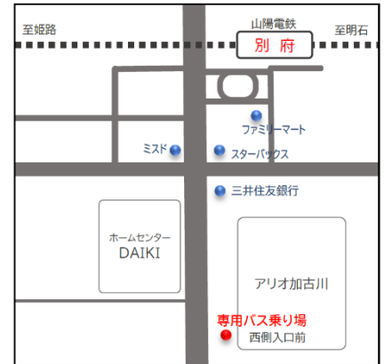
◆山陽電鉄別府駅 (アリオ加古川西入口前)

退勤バスは 17:45 に玄関前広場より発車します。研修終了後は、速やかにご乗車ください。