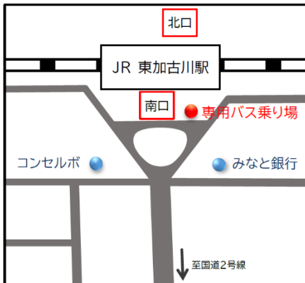
◆JR東加古川駅南口 (南東側階段を下りてすぐ)